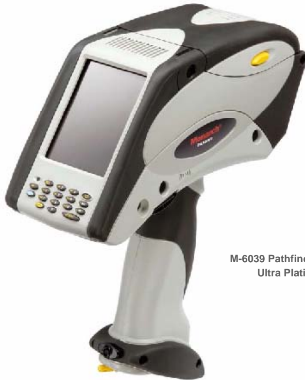
M-6039 Pathfinder Ultra Platinum